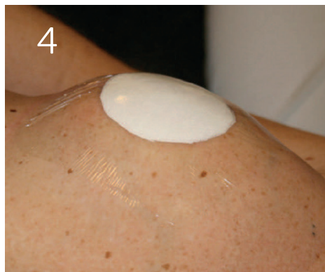
Du får en forbinding på, som du skal beholde på i en uge