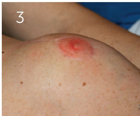
Umiddelbart efter tatoveringen